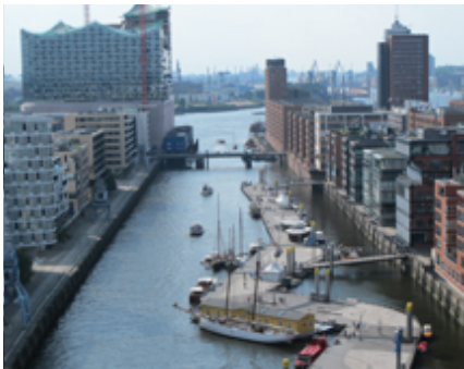
Der Ausblick der siebenköpfige Jury im Jahr 2013 (v.l.n.r.): ...