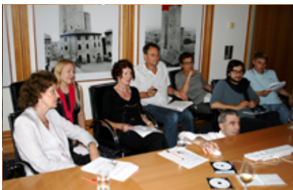
Wenn es eng wird - am Ende - rücken alle zusammen

und Fotochef der Zeitschrift "brand eins" Stefan Ostermeier (Hamburg), der renommierte Fotograf und Künstler Thomas Ruff (Düsseldorf) und Ingo Taubhorn, Kurator am Haus der Photographie, Deichtorhallen, Hamburg. gute aussichten - junge deutsche fotografie 2010/2011 umfasst 146 einzelne Motive, zwei DVDs, zwei Bücher, zwei Texttafeln und ein Diaobjekt. Die Liste der 8 ausgewählten Künstler(innen) steht am Ende der Seite, hier gehts zu den ARBEITEN .