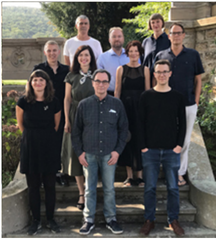
Die komplette gute aussichten 2018/2019 Jury im Sommer 2018