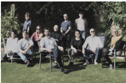
Die 9 gute aussichten 2018/2019 Preisträger*innen im Herbst 2018