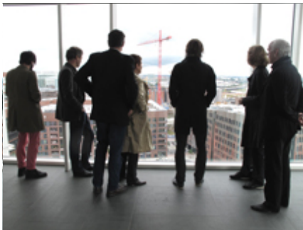
Die achtköpfige Jury 2011: Nur die schönen Rücken entzücken und ...

gute aussichten - junge deutsche fotografie 2011/2012 präsentiert 166 Motive, 4 Bücher, 3 Leuchtkästen, 1 Video und 1 Objekt (Hochstapler-Toast). Die Liste der 7 ausgewählten Künstler(innen) steht am Ende der Seite, hier gehts zu den ARBEITEN .