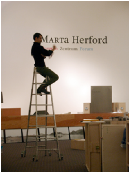
Wer will denn hier, mitten im Aufbau, unbedingt den Überblick behalten?