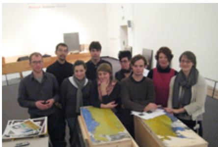
Gruppenbild mit Chefin: Die glücklichen acht von "gute aussichten 2009/2010" mit der Initiatorin