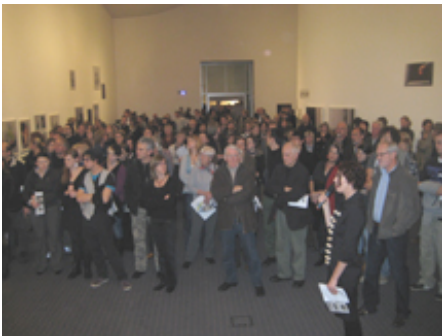
... Keiner geht hin und voll ist es trotzdem immer. Interessiert ...