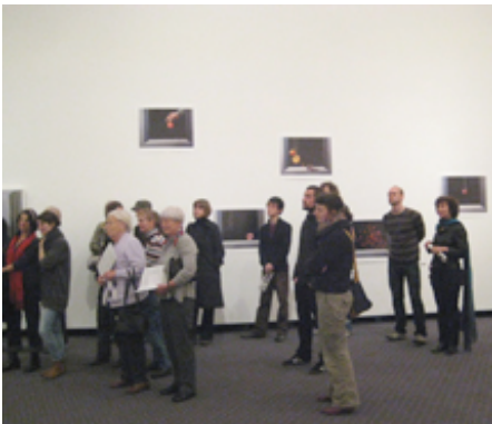
... verfolgten die Besucher die Einführung in die acht Arbeiten