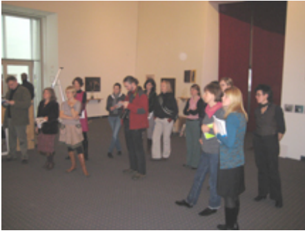
Presse-Präsentation "gute aussichten 2009/2010" am Morgen des 6.11.09 ...