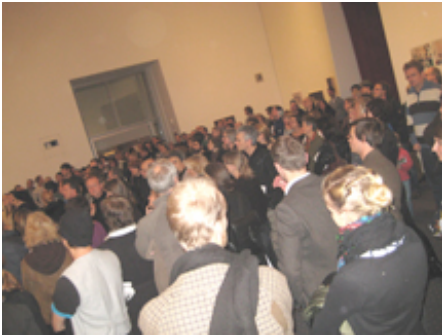
... und die schöne Eröffnung am Abend, wie bei Mc Donalds: ...