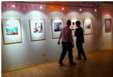
... Nicosia, bei der Eröffnung der "gute aussichten" Ausstellung in 2014

Adress/e: 21, Markos Drakos Avenue, CY 1102 Nicosia, Telefon/Phone +357 22674608, www.goethe.de/ins/cy/nic/ .