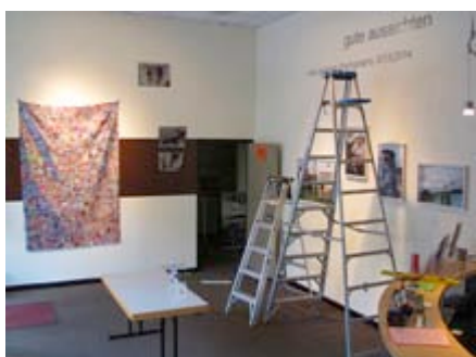
... Aufbau der Ausstellung in 2014 ...