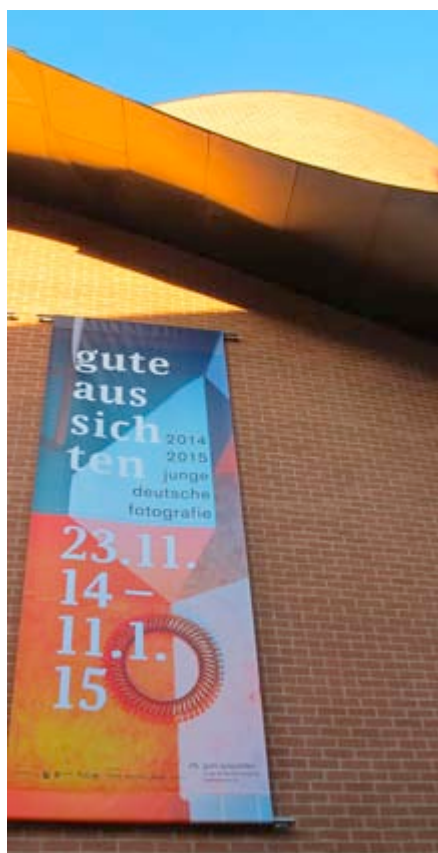
"gute aussichten" im November 2014 im Museum Marta Herford, wo ...