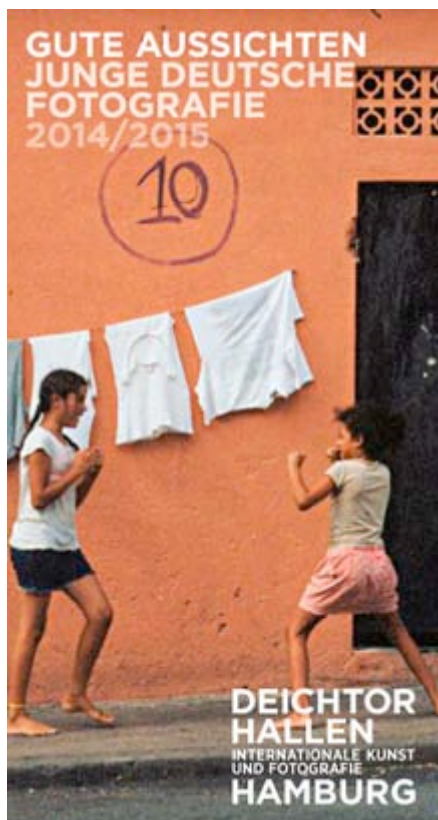
Kampf, Freude, Leidenschaft: Das Motiv für die Einladung in Hamburg, genau ...

Donnerstag 22. Januar 2015 bis Sonntag 8. März 2015 Thursday January 22, 2015 to Sunday March 8, 2015