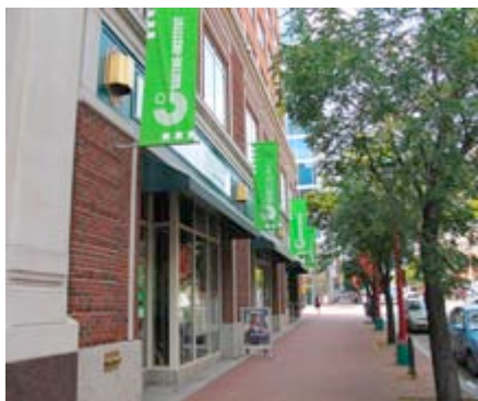
Das Goethe-Institut Washington DC, ...