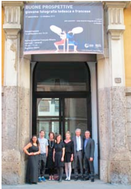
Das "gute aussichten 2013/2014"-Team im Oktober 2014 in Mailand