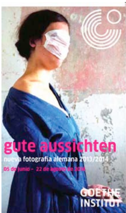
Einladungskarte für "gute aussichten 2013/2014" in Mexico City, wo ...

"gute aussichten 2014/2015" in Nicosia präsentiert eine ebenso schöne wie repräsentative Auswahl der Werke der 8 Preisträger/innen. Die Ausstellung wird begleitet von Rebecca Sampson, Fotografin und "gute aussichten" Preisträgerin 2010/2011", die freundlichweise in die aktuellen Arbeiten und das Projekt einführen wird. Informations about last years "gute aussichten" exhibition in Cyprus.