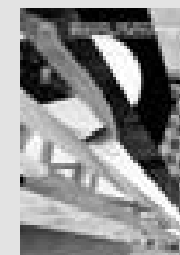
2006/2007 17×21 cm, 220 Seiten 154 Abb., 29,90 Euro ISBN 978-3-83346-484-3