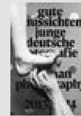
2013/2014 16×24 cm, 224 Seiten 320 Abb., 20,- Euro ISBN 978-3-86895-337-4