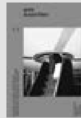
2015/2016 16,5×24 cm, 224 Seiten 350 Abb., 22,90 Euro ISBN 978-3-86490-341-0