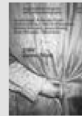
2014/2015 16,5×24 cm, 224 Seiten 320 Abb., 19,95 Euro ISBN 978-3-86490-226-0