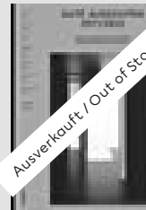
2011/2012 19×26 cm, 240 Seiten 300 Abb., 39,90 Euro ISBN 978-3-84485-289-9