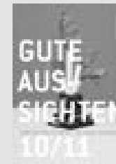
2010/2011 19×26 cm, 240 Seiten 300 Abb., 39,90 Euro ISBN 978-3-83919-602-1