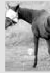
DELUXE Magazin 20×28 cm, 180 Seiten 241 Abb., 10,- Euro ISBN 978-3-981935-51-6