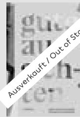
2018/2019 16,5×24 cm, 224 Seiten ca. 400 Abb., 20,- Euro ISBN 978-3-981935-52-3