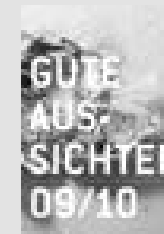
2009/2010 19×26 cm, 240 Seiten 293 Abb., 39,90 Euro ISBN 978-3-83917-357-2