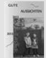
2012/2013 14,8×21 cm, 208 Seiten 300 Abb., 19,- Euro ISBN 978-3-941-263512